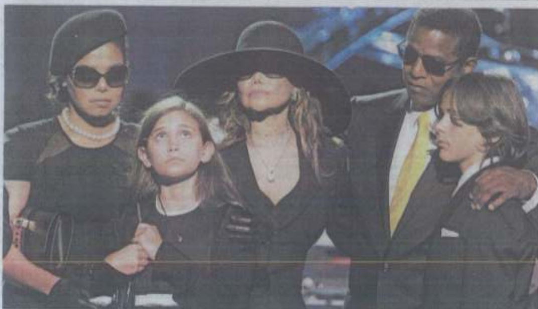
La hija de Michael Jackson, Paris-Michael Katherine, junto a sus tíos Janet, LaToya y Jermaine y su hermano Prince Michael Joseph, ayer en el funeral. » 10